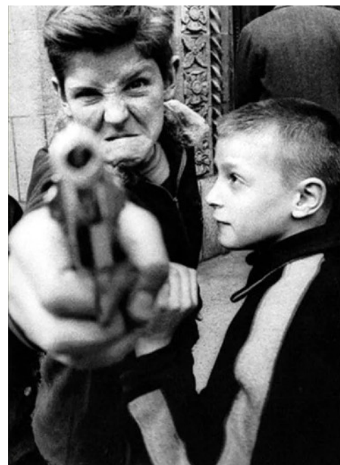
© Broadway y la calle 103 Nueva York (por William Klein 1955)

El enfoque metodológico fomenta la experimentación, el debate informado y el desarrollo de pensamiento crítico, proporcionando una caja de herramientas operativa que permitirá consolidar un proyecto creativo o investigador apoyado en sistemas de inteligencia artificial. Dado que se trata de un ámbito en transformación constante, el conjunto de aplicaciones y servicios utilizados podrá adecuarse al progreso del propio campo y a las necesidades del grupo.