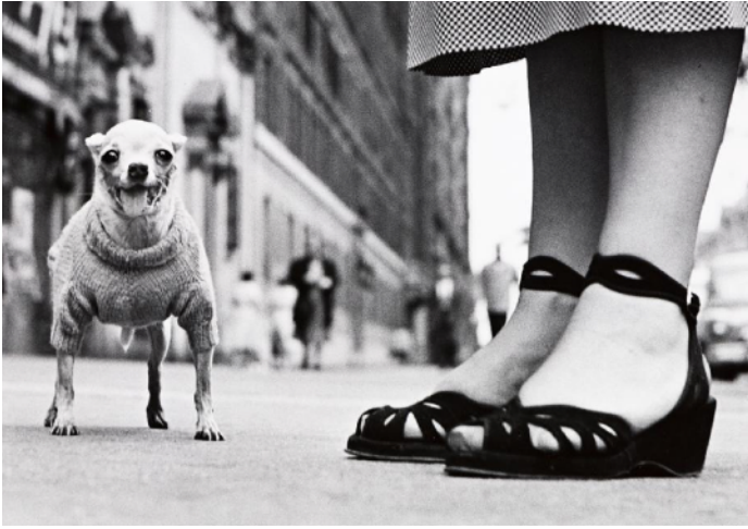
Chihuahua con suéter © Elliott Erwitt 1928.