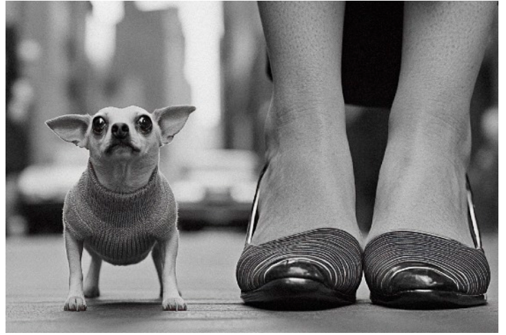
Fake Chihuahua © Manuel San Frutos / Midjourney, 2024

El objetivo del taller es capacitar a los participantes para integrar de manera consciente, rigurosa y estratégica la inteligencia artificial en su práctica artística o académica, desde la comprensión conceptual hasta la ejecución técnica y la reflexión ética